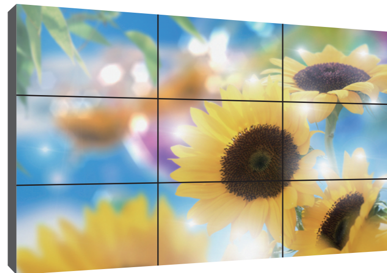
9面(3×3面)マルチディスプレイ設置例

液晶看板アイキャッチグループでは、アイキャッチシリーズ以外にも、多種多様なデジタルサイネージに応えられるよう日々努力しております。業界トップクラスの代理店数が可能にする、ネットワークを通じて、不可能を可能にしてきました。屋外の液晶看板をもっと身近に感じて頂けるよう、液晶看板アイキャッチグループは進化し続けます。※屋内外の液晶看板サイネージのご相談はお気軽にご連絡下さい。